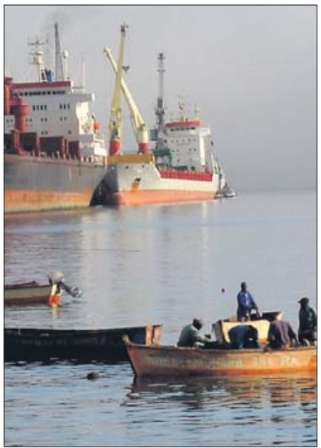
In den Alltag ist Normalität eingeleitet, die Männer fischen nun wieder.

Über Stunden hat das Auge kein Haus, keine Hütte gesehen. Und nun steht er da wie aus dem Nichts. Verblüffend gut geleidet. Dunkelgrauer Anzug. Er reicht