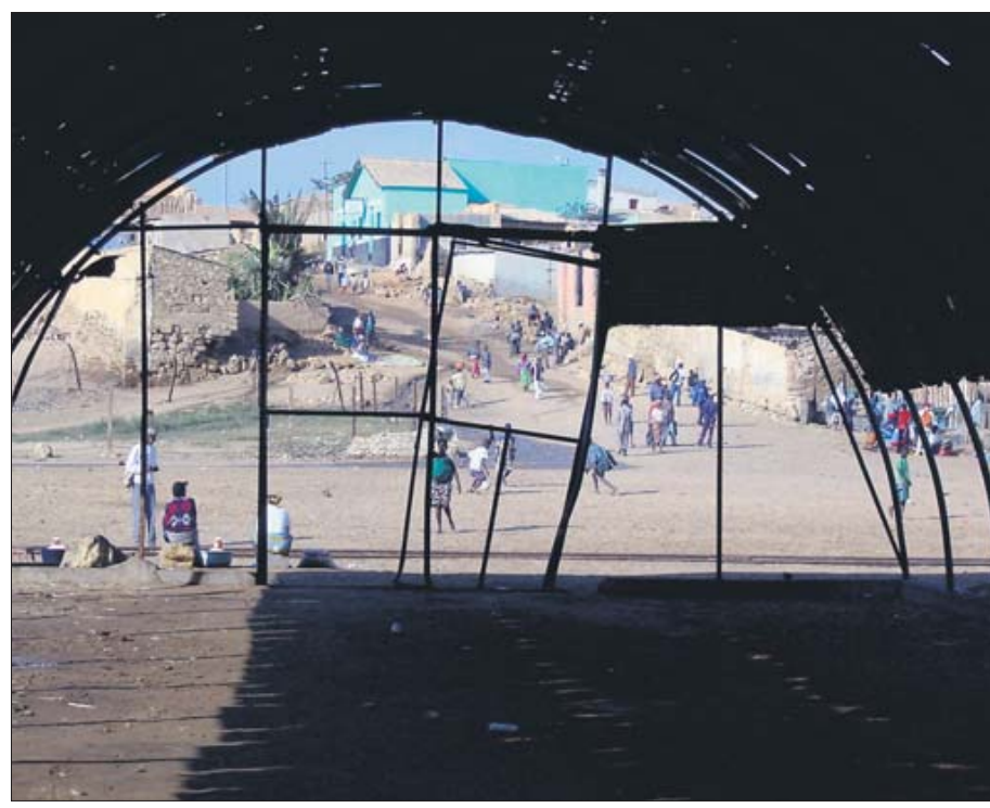
Leben hinter Ruinen: In Angola ist zwar Frieden eingeleitet, aber das Land und seine Dörfer sind noch vom Krieg gezeichnet.

Endlose Strände, eigenartig warme Brandung, zuweilen sogar die enorme Bequemlichkeit des Westens: paradisiische Strandrestaurants auf dem Hauff der Ilha de Luanda vor der Küste der Hauptstadt. Malerische Wracks am Strand von Namibe mit seinen pittoresken Fischmärkten und Fischerbooten, die vor den großen Frachtern aus Übersee fischen. Schlichte, ungewohnt saubere Hotels in Sumbe mit einer perfekten Strandbar, von wo aus die Straße am Queve-Fluss entlang an prallgrünen, von Palmen bestandenen